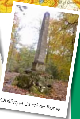
Obélisque du roi de Rome