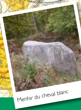
Menhir du cheval blanc