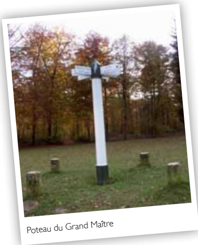
Poteau du Grand Maître

Prendre, dos à la maison forestière, le chemin qui monte au milieu des pins Douglas (longer la parcelle n° 110). En redescendant derrière la butte, vous trouverez sur la droite la fontaine des Lys et l'obélisque au milieu des grands arbres derrière la fontaine. Revenir sur vos pas.