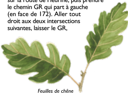
Feuilles de chêne

6 Au carrefour en croix prendre le chemin à gauche. Aller jusqu'au bout sur le petit sentier. Continuer sur le grand chemin et prendre le sentier qui part à gauche. Au carrefour, prendre à droite, continuer tout droit et descendre. Arrivé en bas, longer le mur par la gauche. A la fin du mur, arrivé à une intersection en triangle, prendre à gauche le petit chemin. Au bout du chemin, prendre à droite, là vous rejoindrez une route bitumée rouge, prendre à gauche. Au carrefour Saint-Maurice, prendre à droite sur les bas-côtés puis le premier petit chemin sur la gauche. Continuer tout droit. Aux intersections suivantes, prendre d'abord à droite puis à gauche. Au bout du chemin vous arrivez au point de départ (point d'attache).