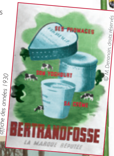
affiche des années 1930