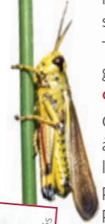
Criquet ensanglanté