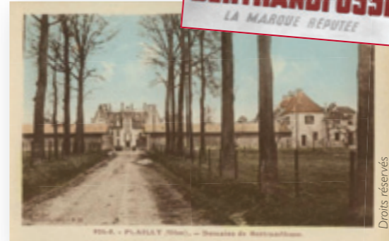
Le château vers 1930

Se dessinant au bout de l'allée (privée), voici le château 7 reconstruit en 1910 à la place d'un vieux manoir Renaissance (15 e s.). Il est entouré d'un parc arboré à l'anglaise. Le domaine comporte également une grande ferme, qui pratiquait au début du 20 e s. l'élevage bovin et ovin, créant même une marque de laitages.