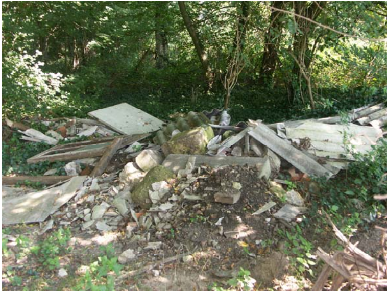
Exemples de nature de déchets