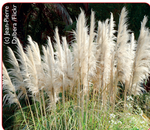
Herbe de la pampa