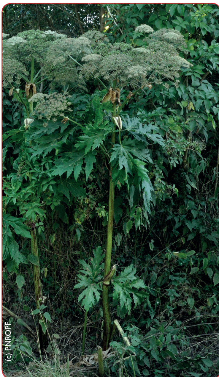
Berce du Caucase