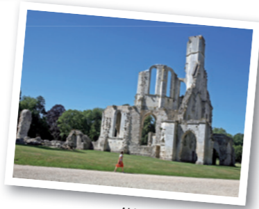
Abbaye royale de Chaalis