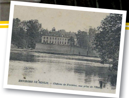
Château de Fontaine (propriété privée)

Descendez la rue longeant le château, vous remarquerez son colombier daté de la seconde moitié du XVI e s. Tournez à gauche sur la route goudronnée forestière qui vous ramène à l'abbaye.