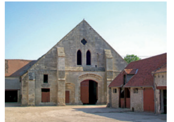
Ferme de Fourcheret (propriété privée)

En dehors du parcours, dans la plaine, voici la ferme de Fourcheret ♦. L'abbaye de Chaalis possédait un très grand nombre de dépendances sous la forme de granges monastiques qui contribuaient à lui assurer des revenus colossaux. La ferme de Fourcheret était l'une d'entre elles. Outre une vaste exploitation céréalière, la propriété comprenait des pâturages ainsi qu'un moulin sur les bords de la Nonette. Sa grange monumentale de 52 m de long date du tout début du 13 e s. Elle servait à stocker, sous forme de récolte, le revenu de la dîme, d'où son nom de grange dîmière.