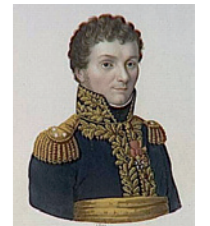
Général Kellerman, fils du maréchal Kellerman