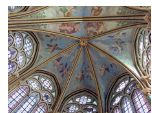
Fresques du Primate dans la chapelle abbatiale

Vous voici devant l' abbaye royale de Chaalis ♦, fondée en 1137 par Louis VI et construite au début du 13 e s. Aimée des souverains, tout particulièrement de Saint-Louis et Charles V, elle devient un foyer économique et intellectuel important. A la Renaissance, l'abbaye accueille d'ailleurs de grands artistes italiens invités par