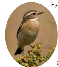
Tarier des près

Face à l'abbaye, prenez à gauche, puis au premier carrefour, à droite. Le long de la route rejoignant Montlognon, à l'ombre d'un imposant marronnier, vous trouverez au bord de la fontaine Sainte-Geneviève ♦ et de son calvaire une halte des plus paisibles. La source assez abondante, alimente le ruisseau de la fontaine Sainte-Geneviève, et