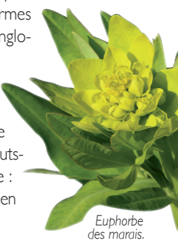
Euphorbe des marais.

Arrivée à l'ancien hameau du Lys, qui abrite encore une pittoresque chapelle Saint Vaast P , entourée d'un vieux cimetière. Voyez également, au carrefour vers Viarmes et Royaumont, une vaste demeure, ancien relai de chasse, de style anglo-normand (pans de bois). Non loin de là, au sud de la route D118 (en partie longée par une piste cyclable), s'étend une vaste zone humide protégée : le marais du Lys (zone Natura2000). Il abrite notamment l'Euphorbe des marais, grande plante aux délicates fleurs jaunes (espèce en danger dans la région Hauts-de-France). Au niveau de la faune, le marais détient une espèce protégée : L'Agrion de Mercure. Cette libellule au statut vulnérable est peu présente en Picardie du fait de la modification de son habitat par l'Homme.