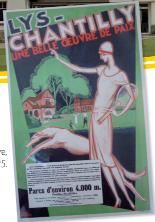
Affiche publicitaire, vers 1925.