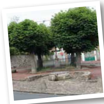
Place, croix et ancien puits

En sortant de la mairie prenez la rue Cateau en face jusqu'à la place du Calvaire . Réaménagée en 1989, elle marquait autrefois l'entrée du cimetière, situé de ce côté-ci de l'église. Observez au centre de la place, entourée de marronniers et protégée d'une grille, la croix de la fin du 19 e s / début du 20 e s avec son Christ en croix en fonte peinte protégé d'un auvent en zinc. À côté, la margelle monolithe du 15 e s est un ancien puits bouché, enfoui, retrouvé dans la cour des locaux municipaux, puis placé ici. Le dessus est grossièrement évidé en gouttière et se termine par un bec. Trois anciens trous rappellent la structure en ferronnerie supportant la poulie qui surmontait le puits.