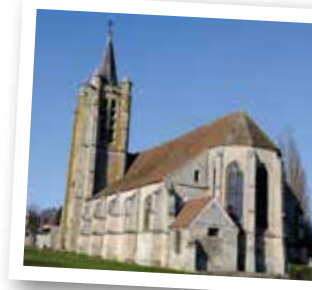
Clocher, nef et abside de l'église Saint-Martin

Grâce à une politique sociale forte, environ 200 logements sont édifiés pour l'ensemble du personnel, avec eau courante, gaz, électricité et jardin, constituant plusieurs petites cités ouvrières dans le village (rues de la Cartoucherie, d'Enfresne, Charles Gabel). Passez entre le château d'eau et le réfectoire, continuez tout droit avec à votre droite les jardins partagés, poursuivez sur la sente, après les murs de briques prenez à gauche pour aboutir à un autre quartier d'habitations de la Cartoucherie formant un ensemble architectural homogène à préserver. Descendez l'avenue Charles Gabel, traversez la rue du Houx ⚠ et entrez par le portail dans le parc de la Mairie pour revenir à votre point de départ.