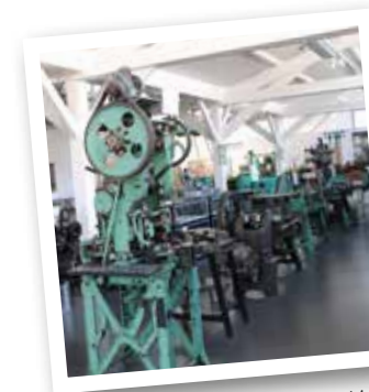
Anciennes machines installées au Musée de la Cartoucherie

Prenez à gauche la Grande rue sur 400m, passez devant le Musée de la Cartoucherie , où sont exposées d'anciennes machines et la maison du directeur, tournez à droite chemin des Neuf Moulins jusqu'aux deux pavillons d'entrée de l' usine de la Cartoucherie , créée en 1903. L'usine de pyrotechnie fabrique alors des munitions, des cartouches et des détonateurs. La production, destinée à l'armée s'arrête en 1990. On produit maintenant des détonateurs pour les airbags de voiture et pour le bâtiment.