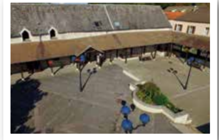
Vue aérienne de la place de la bergerie

Empruntez la rue d'Alsace-Lorraine pour longer l'église et l'agréable place bordée d'un double mail de tilleuls. Remontez la rue Jean Jaurès en passant devant l'ancienne mairie-école de 1889 toute en meulière et l'école des filles au style moderniste typique de 1933/37 jusqu'à la place de la Bergerie .