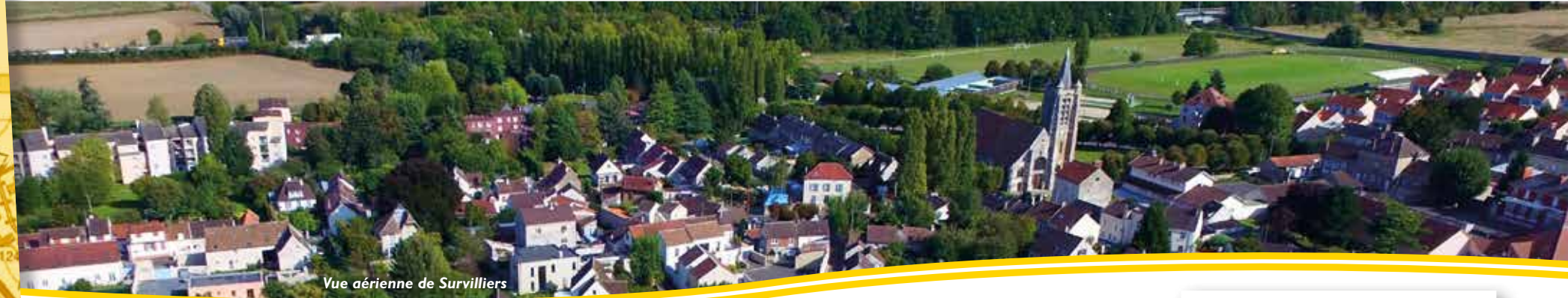
Vue aérienne de Survilliers