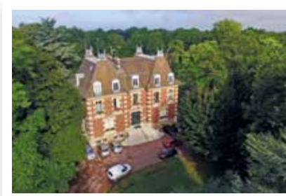
Ancien château transformé en mairie

Départ depuis l' hôtel de ville , construit au début du 20 e siècle à l'emplacement d'un ancien château du 18 e s. Plusieurs propriétaires se succèdent jusqu'au frère de Napoléon : Joseph Bonaparte qui l'acquiert en 1803. Après un incendie en 1903, il est rapidement reconstruit dans le style néo-Louis XIII : soubassement en meulière, briques et pierre de taille pour le corps central encadré de deux pavillons en avancée, ouvertures régulières et symétriques et hauts toits à quatre pentes. La municipalité