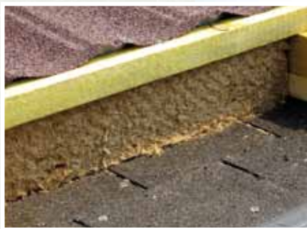
▲ Isolation par laine de bois.