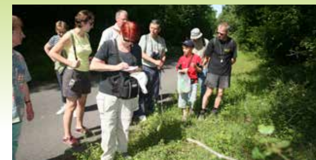
Sortie botanique en forêt d'Halatte