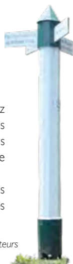
Poteau des Écouteurs

Les poteaux, installés aux carrefours des allées forestières pour indiquer les directions lors des chasses à courre et les bornes armoriées, délimitant les parcelles, sont les témoins du passé princier de cette forêt.