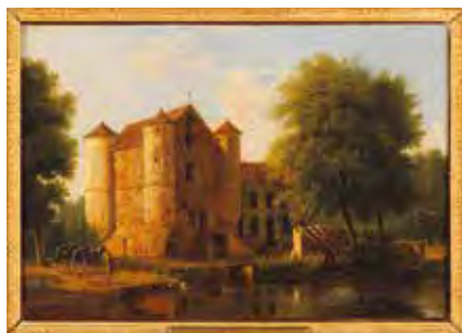
JV Bertin, Château de la Reine Blanche , v. 1825

Au début du 19 e s. l'activité s'arrête et le moulin est détruit. Le château-fort du 13 e s. est remanié en 1825 par le prince de Condé dans le style néo-gothique (décors travaillés : pinacles, balustrades, statues de chevaliers, gargouilles...). Site prisé à la période du Romantisme, où il prend son nom actuel, il a été représenté à de très nombreuses reprises dès la fin du 18 e s. (estampes, gravures, dessins, tableaux). Le sentier longeant les étangs vous permettra de profiter du paysage.