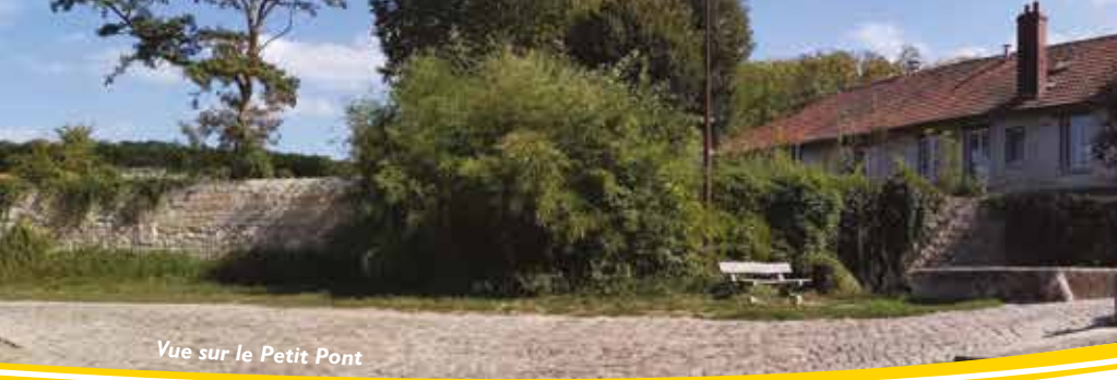
Vue sur le Petit Pont