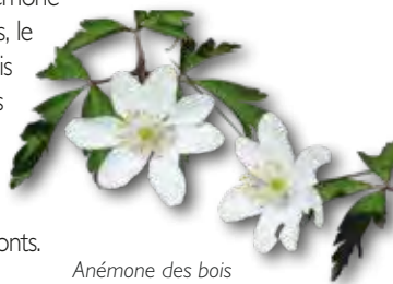
Anémone des bois (Anemone nemorosa)

Sur cette portion vous pourrez apercevoir l'Alliaire officinale, l'Anémone des bois, l'Arum tacheté, la Benoîte commune, la Circée de Paris, le Doronic à feuilles de plantain, l'Iris fétide, la Jacinthe des bois, l'Orchis pourpre, la Petite Pervenche et la Renoncule ficaire. En levant les yeux vous reconnaîtrez le Charme, le Chêne pédonculé, des érables, le Frêne, le Hêtre et le Sureau noir. Au poteau n°2, descendez à gauche pour rejoindre et traversez la route, continuez tout droit sur 400m sur la Chaussée du Porchène en passant sur deux petits ponts.