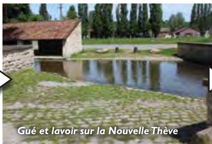
Gué et lavoir sur la Nouvelle Thève