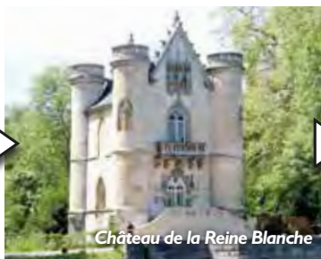
Château de la Reine Blanche