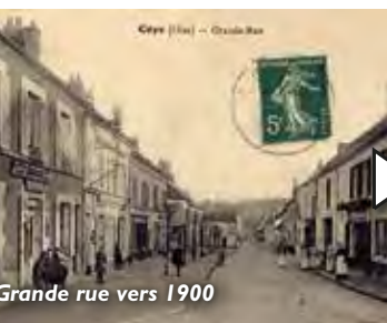
Grande rue vers 1900