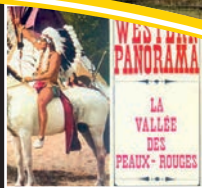
le parc d'attraction

Le « chêne à l'image », les « Trois frères », l'obélisque du roi de Rome, la fontaine Bertrand ou celle des Lys, le temple gallo-romain sont autant de lieux pittoresques et but de promenades proches en forêt (voir dépliant en mairie).