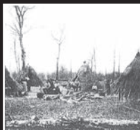
charbonniers, vers 1900