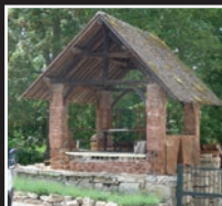
exemple de four (privé)