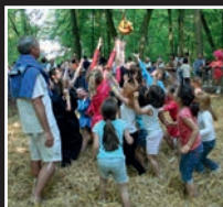
fête de la brioche, de nos jours