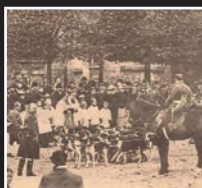
fête de St. Hubert, vers 1900