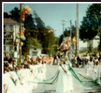
bouquet provincial, 1979