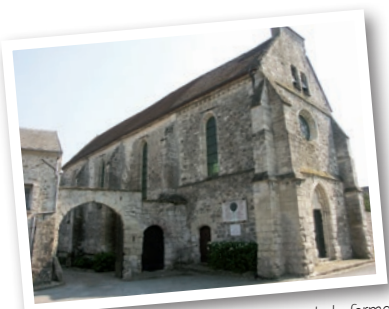
L'église et l'entrée de la ferme

Son plan est simple : un vaisseau rectangulaire de 28m par 8,5m. Il comprend 4 travées