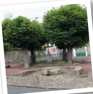
Place, croix et ancien puits

En sortant de la mairie prenez la rue Cateau en face jusqu'à la place du Calvaire . Réaménagée en 1989, elle marquait autrefois l'entrée du cimetière, situé de ce côté-ci de l'église. Observez au centre de la place, entourée de marronniers et protégée d'une grille, la croix de la fin du 19 e s / début du 20 e s avec son Christ en croix en fonte peinte protégé d'un auvent en zinc. À côté, la margelle monolithe du 15 e s est un ancien puits bouché, enfoui, retrouvé dans la cour des locaux municipaux, puis placé ici. Le dessus est grossièrement évidé en gouttière et se termine par un bec. Trois anciens trous rappellent la structure en ferronnerie supportant la poulie qui surmontait le puits.