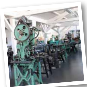
Anciennes machines installées au Musée de la Cartoucherie

Prenez à gauche la Grande rue sur 400m, passez devant le Musée de la Cartoucherie , où sont exposées d'anciennes machines et la maison du directeur; tournez à droite chemin des Neuf Moulins jusqu'aux deux pavillons d'entrée de l'usine de la Cartoucherie , créée en 1903. L'usine de pyrotechnie fabrique alors des munitions, des cartouches et des détonateurs. La production, destinée à l'armée s'arrête en 1990. On produit maintenant des détonateurs pour les airbags de voiture et pour le bâtiment.