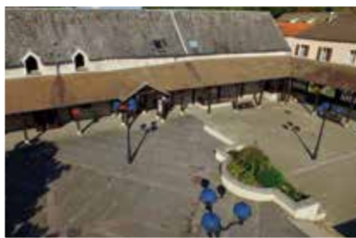
Vue aérienne de la place de la bergerie

Cette place piétonne et la Maison des arts (école de musique, théâtre, bâtiments associatifs) ont été aménagées en 1988 à l'emplacement d'une ancienne ferme, pour devenir un espace de rencontres et de convivialité, où ont lieu les manifestations culturelles de la commune.