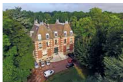
Ancien château transformé en mairie

Un boisement prolonge ce parc avec une flore vernale (floraisons au printemps : jacinthe, jonquille) intéressante à préserver. Des vestiges des tranchées du Camp retranché de Paris (1914-1918) subsistent dans les bois de la garenne du Houx.