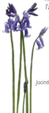
Jacinthe des bois ( Hyacinthoides non-scripta )