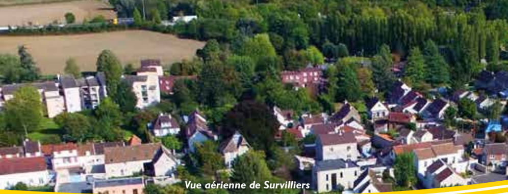
Vue aérienne de Survilliers