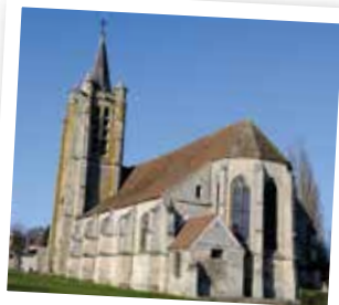
Clocher, nef et abside de l'église Saint-Martin

Dirigez-vous à droite rue Pasteur sur 60m jusqu'à l' église Saint-Martin , fondée en 1354 par Guillaume de Meaux. De cette église d'origine, il ne reste que le clocher-tour carré déporté sur le côté droit, avec contreforts et coiffé d'une flèche octogonale. L'édifice actuel date de la fin du 15 e s. Remarquable par son unité, de style gothique, elle est constituée d'une nef à quatre travées flanquée de deux bas-côtés et terminée par un chevet polygonal. Le portail en anse de panier surmonté d'une baie en plein cintre avec un double réseau d'arcs moulurés, date de reprises effectuées en 1884 par l'architecte Boulogne dans le style flamboyant. Classée monument historique depuis 1945, elle a subi d'importants travaux de rénovation entre 1976 et 2007. Les grosses bornes sur le parvis proviennent de l'ancien portail du château. L'intérieur est intéressant pour sa Vierge à l'Enfant au buisson ardent du 14 e s, son aigle-lutrin et ses voutes de style Renaissance.