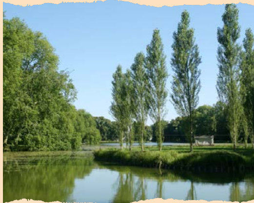
Parc Jean Jacques Rousseau

Ami randonneur, profitez de la nature et protégez-la ! Suivez et faites respecter ces quelques conseils :