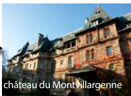
château du Montvillargenne