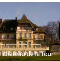
château de la Tour