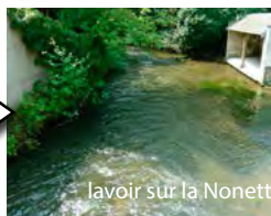
lavoir sur la Nonette