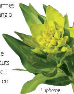
Euphorbe des marais.

Non loin de là, au sud de la route D118 (en partie longée par une piste cyclable), s'étend une vaste zone humide protégée : le marais du Lys (zone Natura2000). Il abrite notamment l'Euphorbe des marais, grande plante aux délicates fleurs jaunes (espèce en danger dans la région Hauts-de-France). Au niveau de la faune, le marais détient une espèce protégée : L'Agrion de Mercure. Cette libellule au statut vulnérable est peu présente en Picardie du fait de la modification de son habitat par l'Homme.