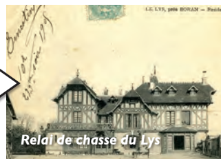
Relai de chasse du Lys