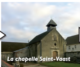
La chapelle Saint-Vaast