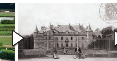
Le château, vers 1900

Poursuivez vers « l'île de la Thève », un vaste espace naturel entre la Thève et le ru St-Martin. Au bout de la rue de l'église, prenez l'impasse de l'abreuvoir. Découvrez, observez, flânez... Revenez, remontez la rue Jean Biondi vers la place du Marronnier ❸ P .