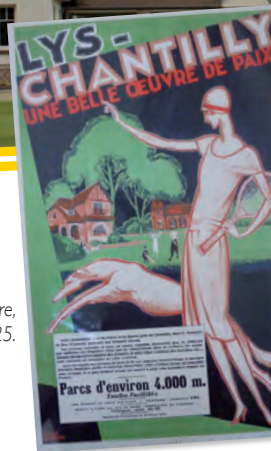
Affiche publicitaire, vers 1925.