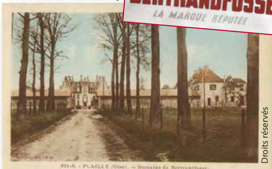
Le domaine vers 1930