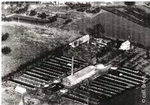
Vue aérienne, années 1950

A partir du 18 e siècle, de très nombreuses carrières, aujourd'hui abandonnées, ont permis d'extraire les ressources du sous-sol. Autour de la colline de Montmélian s'échappaient les fumées des fours à plâtre (gypse cuit), des tuileries et de la briqueterie (1920), dont la cheminée 11 est toujours visible (▲ accès interdit et dangereux!).