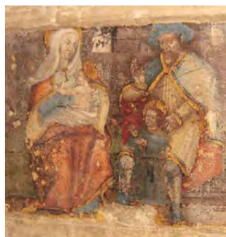
Peinture murale de la Vierge, dans l'église

Remontez la rue Bouchard puis la rue de la Libération sur 20 mètres. Vous y croiserez là une statue 3 en métal de la Vierge à l'enfant (1908) dans une position très rare.