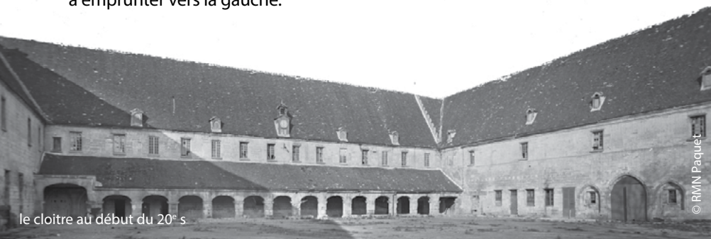
le cloître au début du 20 e s

Engagez-vous dans la rue du Moncel pour découvrir les tours de Fécamp ❷. Dos aux tours, remontez par la ruelle goudronnée jusqu'à la rue de Crépy, à emprunter vers la gauche.