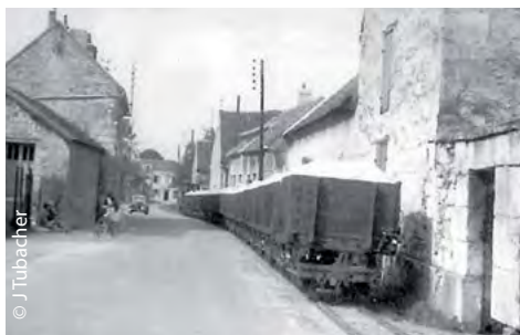
train circulant rue de Tournelles

A 1,5 km à l'est, le hameau de Moru présente plusieurs curiosités: une partie de ce hameau, partagé avec Roberval, a été rattaché à Pontpoint en 1848; il était par ailleurs traversé jusqu'en 1964 par un petit train , transportant chaque jour près de 1 000 tonnes de sable d'Halatte vers le port de l'Oise.