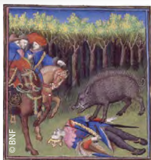
l'accident de chasse fatal de Philippe IV le Bel en forêt d'Halatte, enluminure du 14 e s.