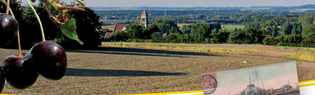
Cerises "Cœur de Verberie"