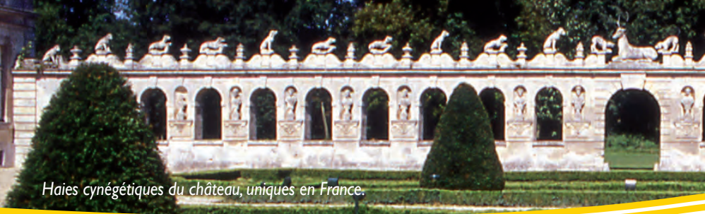
Haies cynégétiques du château, uniques en France.