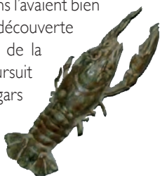
Objet archéologique à décor d'écrevisse, 1 er -4 e s.

Cette très grande ferme isolée est située à 2,8km au nord-est du village, au-delà de la ligne de T.G.V. Comme ses autres consœurs, elle comporte les mêmes éléments caractéristiques (logis, granges, etc.), réhaussés des lierres grimpants. De plus, quelques beaux arbres (marronnier, tilleul...), sont les bienvenus dans ce plat pays. Il y a aussi une mare, car cette commune n'a ni source ni ruisseau. Mais la terre y est riche et les peuples anciens l'avaient bien noté. Une villa romaine a notamment été découverte non loin, fouillée lors de la construction de la ligne T.G.V. L'exploitation agricole s'y poursuit intensément de nos jours, grâce à ses hangars gigantesques et son récent méthaniseur.