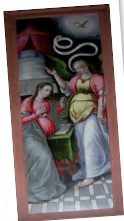
L'Annonciation, avec la Vierge Marie et l'archange Gabriel.

Juste à côté, admirez l'église Saint-Nicolas (M.H.). Son clocher remonte au 12 e s., mais le reste de l'édifice, reconstruit dans les années 1520/1530, est profondément marqué par le style gothique flamboyant. Appréciez notamment le portail, l'un des plus richement décorés des environs : la porte en anse de panier est surmontée d'une large archivolte en accolade, encadrée de trois niches à statues (disparues), le tout finement sculpté dans la pierre calcaire. À l'intérieur, deux panneaux peints à double faces ornent la nef. Du début du 17 e s., ces anciennes portes de la sacristie racontent quatre scènes de la vie de la Vierge et de l'Enfant Jésus, dans de vives couleurs : la Visitation, l'Annonciation, l'Adoration des Bergers et la Circoncision.