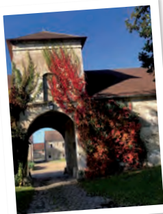
Pigeonnier-porche (propriété privée, ne se visite pas).

Cette très grande ferme isolée est située à 2,8km au nord-est du village, au-delà de la ligne de T.G.V. Comme ses autres consœurs, elle comporte les mêmes éléments caractéristiques (logis, granges, etc.), réhaussés des lierres grimpants. De plus, quelques beaux arbres (marronnier, tilleul...), sont les bienvenus dans ce plat pays. Il y a aussi une mare, car cette commune n'a ni source ni ruisseau. Mais la terre y est riche et les peuples anciens l'avaient bien noté. Une villa romaine a notamment été découverte non loin, fouillée lors de la construction de la ligne T.G.V. L'exploitation agricole s'y poursuit intensément de nos jours, grâce à ses hangars gigantesques et son récent méthaniseur.