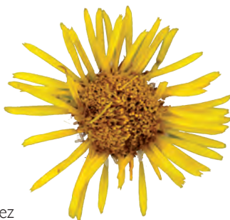
Inule à feuille de saule.

Retour au départ par le chemin inverse (en face jusqu'au feu, puis à droite).