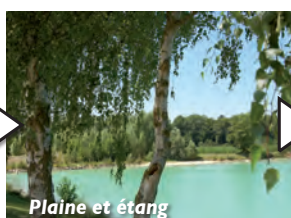
Plaine et étang