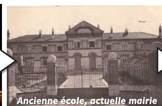
Ancienne école, actuelle mairie