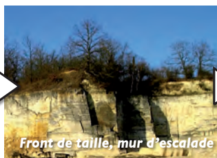
Front de taille, mur d'escalade