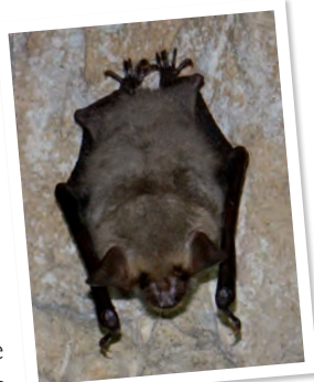
Chauve-souris Grand Murrin.

Prenez à droite le chemin qui revient vers le village, côtoyant la clôture et un autre étang. Marchez le long du coteau rue Croizat puis rue de Trossy.