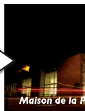
Maison de la Pierre