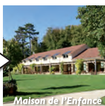
Maison de l'Enfance