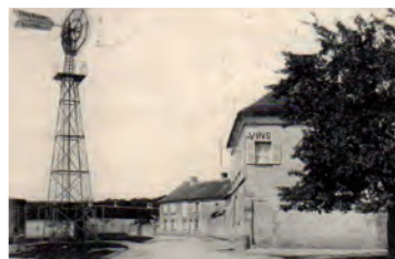
La place vers 1900.

L'absence de rivière explique le grand nombre de puits communs partagés par 2 ou 3 habitations. Sur cette place, en 1898, sont construits un abreuvoir, un lavoir et un réservoir à incendie alimentés par une éolienne (disparus).