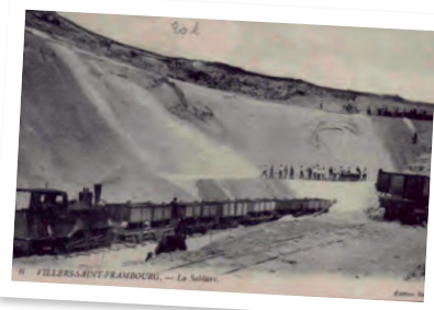
La carrière, vers 1900.

Jusqu'à une époque assez récente, tous les bâtiments étaient construits avec des matériaux trouvés à proximité du village : la pierre calcaire, le grès, le sable, la terre, le bois... Observez les nombreux exemples d'architecture traditionnelles dans cette rue. Au nord-est de la commune se trouve une carrière . Fin 19 e s., son sable de qualité était transporté par un petit train jusqu'à l'Oise. Aujourd'hui, il est toujours exploité pour l'industrie verrière.