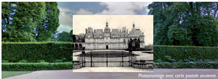
Photomontage avec carte postale ancienne.

Au carrefour, suivant l'ancienne plaque routière dite « Michelin », dirigez-vous à gauche, direction Villers-St-F. et longez de hauts murs de pierre jusqu'à l'entrée de l'ancien château 6, aujourd'hui disparu (propriété privée). Après un château médiéval, un second est reconstruit à la Renaissance par la famille La Fontaine, puis embelli par le fortuné Maximilien Titon (parc remarquable M.H.). Un dernier château (1883) est démoli en 1957.