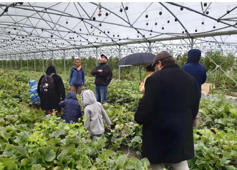
Visite de la "ferme de Basile"