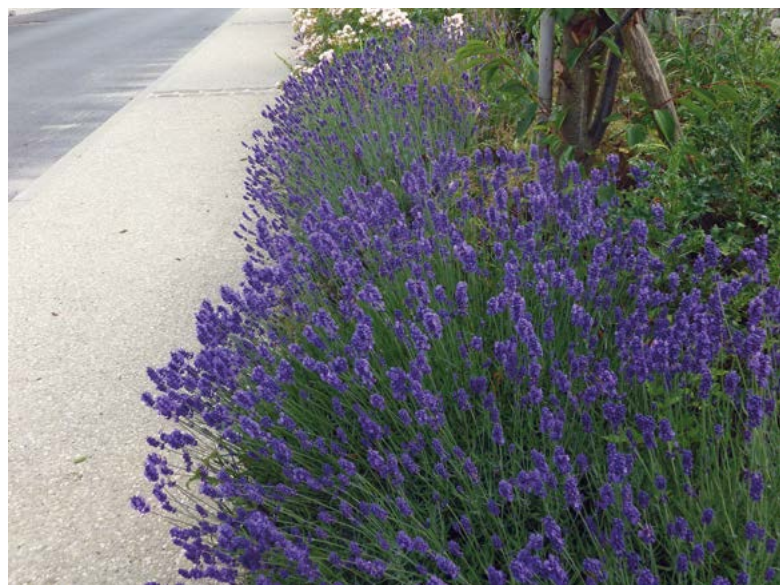
Massif de vivaces à Saint-Maximin

La gestion différenciée repose sur une idée simple : adapter l'entretien en fonction du type d'espace, de son usage et de son emplacement. Les zones dites "de prestige" (parvis de mairie, massifs fleuris du centre-bourg...) continuent à recevoir un entretien soigné, de même que les ronds-points qui exigent une bonne visibilité. À l'inverse, des secteurs plus périphériques ou moins fréquentés, comme les talus routiers ou les bords de rivière, bénéficient d'un entretien plus extensif. Les zones de détente ou de passage comme les parcs et squares font fréquemment l'objet d'une gestion intermédiaire.