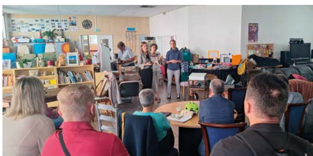
Au Tiers-Lieu à Senlis

Cette année, le Parc naturel régional Oise-Pays de France a conduit une étude pour mieux connaître ces lieux en plein essor sur son territoire. Issus de l'économie sociale et solidaire, ils reposent sur des modèles de gouvernance variés, laissant une large place au bénévole. Leurs thématiques sont multiples : culture, alimentation, écologie, mobilité, inclusion sociale... autant de sujets au cœur de la vie locale.