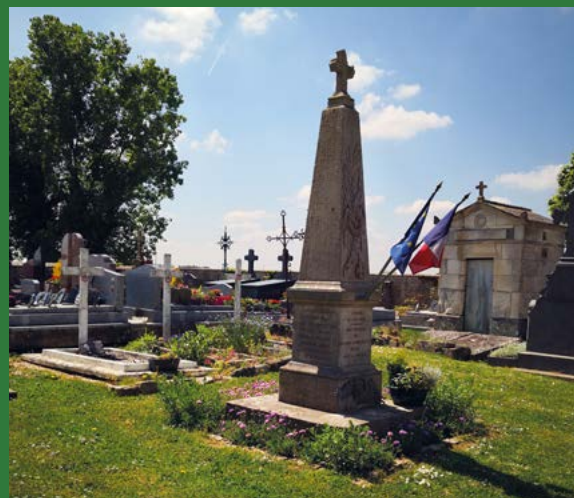
Engazonnement et plantation au cimetière à Montagny-Sainte-Félicité

Longtemps gérés comme des espaces minéraux, les cimetières évoluent aujourd'hui dans certaines communes vers de véritables "jardins funéraires". À titre d'exemple, les allées sont enherbées, des vivaces sont plantées entre les tombes, des arbres et des haies champêtres sont implantés pour créer un cadre apaisé et générer de l'ombre. Plusieurs communes du Parc naturel régional se sont lancées dans cette dynamique : Creil pour le cimetière du Plessis-Pommeraye, Barbery, Pontarmé, Précy-sur-Oise, Villers-Saint-Frambourg, Boran-sur-Oise, Rully, etc.