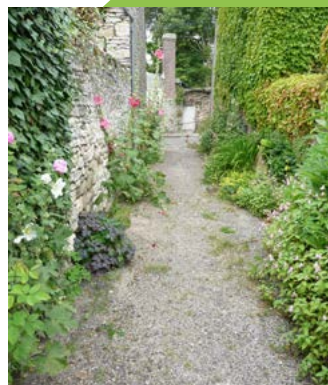
Plantations en pied de mur à Barbery

Chaque année, le Parc naturel régional organise un séminaire des délégués communaux : l'édition 2025, qui s'est tenue à Plailly le 17 octobre, a été consacrée à la gestion différenciée. Ce fut l'occasion d'échanger sur les expériences, les réussites, mais aussi les interrogations, et de renforcer cette dynamique collective.