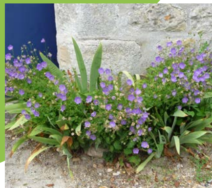
Vivaces en pied de mur à Courteuil

En plus de mieux tolérer les herbes spontanées, nous pouvons être actifs en accompagnant l'effort communal : participer au fleurissement devant chez soi, laisser un coin de jardin en friche, être les premiers ambassadeurs de cette nouvelle esthétique du végétal. Pourquoi ne pas végétaliser le pied de vos murs avec des roses trémières ou des campanules ? Vous contribuerez à embellir votre commune.