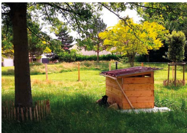
Eco-pâturage à Fosses