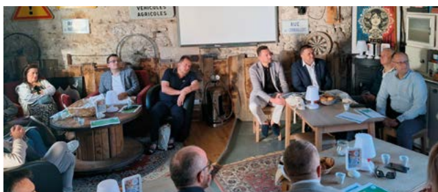
Café citoyen à Auger-Saint-Vincent

Sept tiers lieux ont été recensés sur le territoire :