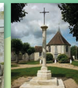
C Le calvaire de Thiers-sur-Thève