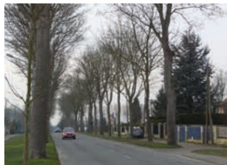
▲ Avenue de Creil avant les travaux

Les engins s'activent avenue de Creil, une avenue longue de plusieurs kilomètres. L'artère représente un trait d'union essentiel entre la vallée de l'Aunette et le carrefour de l'Obélisque, mais elle souffrait de défauts majeurs : des stationnements trop souvent improvisés, une contre-allée mal exploitée, du mobilier devenu vétuste par endroits, sans oublier un alignement d'arbres malades... Aussi fallait-il revaloriser et sécuriser cet axe de circulation.