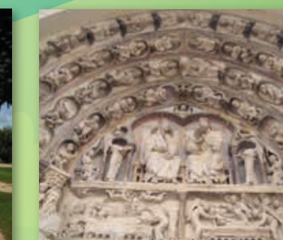
D Les sculptures du fronton de la Cathédrale de Senlis

Réponse : D, le Parc n'a pas financé la restauration du fronton de la Cathédrale de Senlis