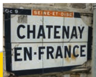
▲ Plaque murale avant