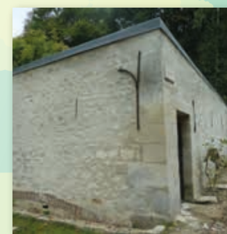
A Le lavoir d'Aumont-en-Halatte

Chaque année le Parc aide les communes à restaurer son petit patrimoine. Parmi les monuments suivants, lequel n'a pas été restauré par le Parc ?