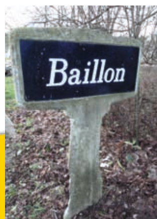
▲ Plaque sur pied avant