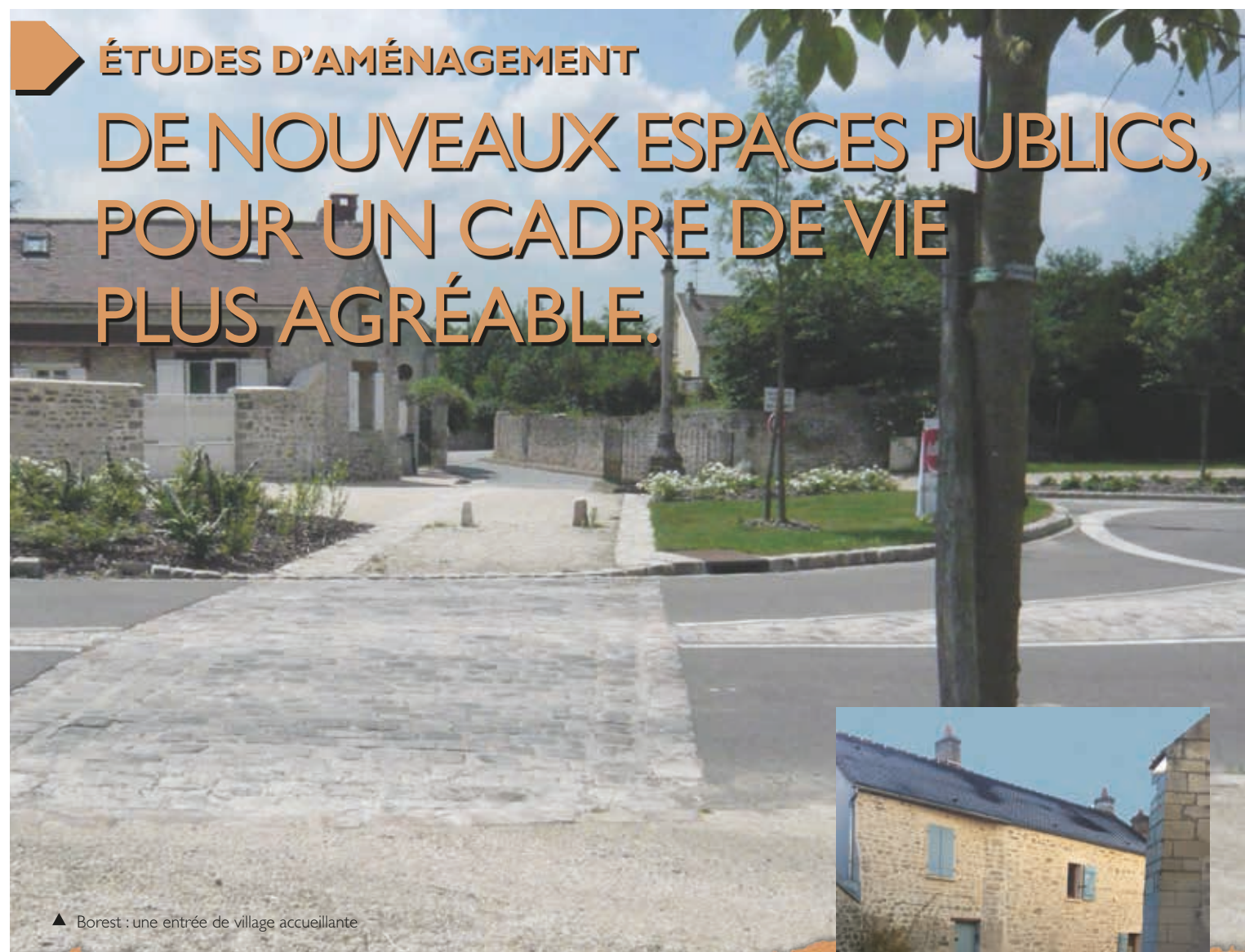
▲ Borest : une entrée de village accueillante