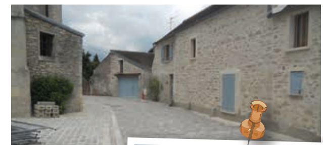
▲ Rues pavées et effets de relief contribuent à «théâtraliser» le patrimoine bâti, tout en organisant l'espace.