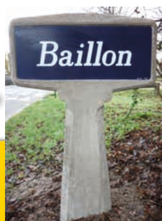
▲ après restauration