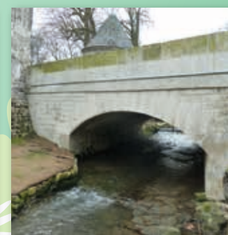
B Le Pont d'Ermenonville