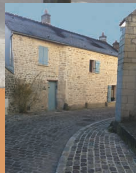
▲ Rue piétonne à Chamant

AU CŒUR DE NOS VILLES ET VILLAGES, LES PLACES, CARREFOURS, RUES ET TROTTOIRS COMPOSENT LES ESPACES PRIVILÉGIÉS DE NOTRE VIE DE TOUS LES JOURS. C'EST DIRE SI LEUR AMÉNAGEMENT EST UN ENJEU FORT.