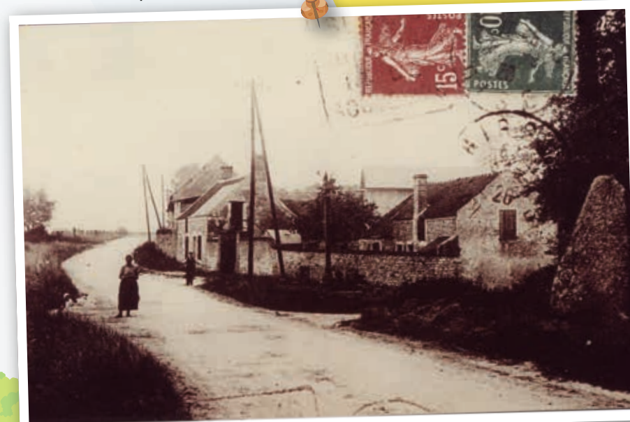
Réponse : La photo de cette carte postale a été prise à l'entrée de Borest