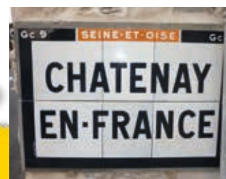
▲ après restauration