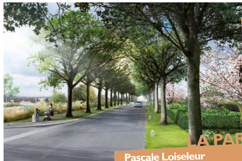
▲ Projet après travaux