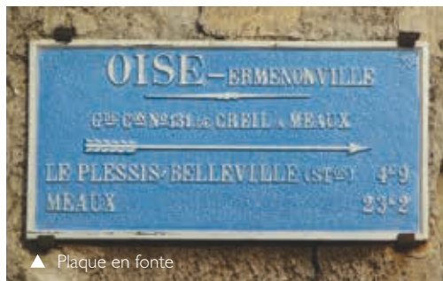
▲ Plaque en fonte

Au XIX e siècle, la nécessité de guider les voyageurs avait amené les pouvoirs publics à implanter des plaques indicatrices sur les murs, en sortie de village ou aux carrefours. Positionnées à hauteur de cocher, ces plaques en fonte portaient des indications en lettres blanches sur fond bleu.