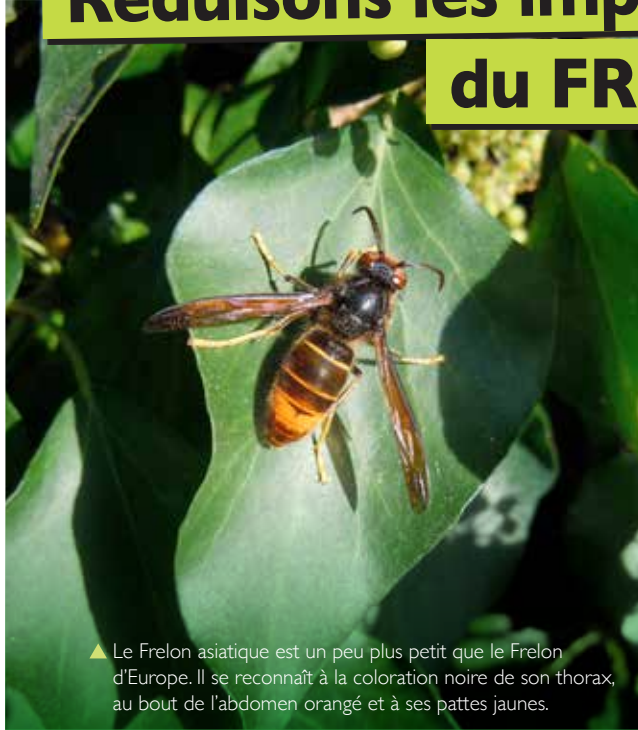
▲ Le Frelon asiatique est un peu plus petit que le Frelon d'Europe. Il se reconnaît à la coloration noire de son thorax, au bout de l'abdomen orangé et à ses pattes jaunes.