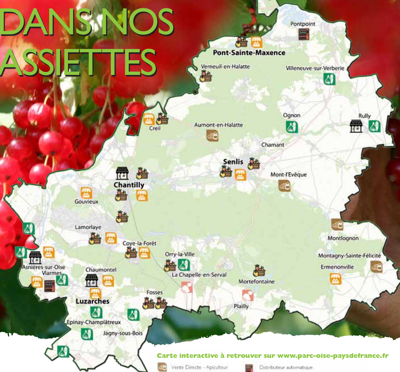
Carte interactive à retrouver sur www.parc-oise-paysdefrance.fr