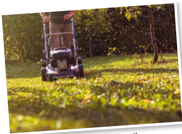
Je tonds ma pelouse autrement.

La biodiversité, c'est l'affaire à tous. Nos jardins et nos rues sont des lieux de vie pour beaucoup d'espèces si nous savons encourager cette diversité. Encore faut-il préférer les prairies au gazon tondu à ras, les haies champêtres aux haies composées d'une seule espèce, les plantes vivaces aux annuelles, les arbres fruitiers aux résineux... L'installation de petits tas de bois, de murets en pierre, de gîtes à insectes ou de nichoirs sont autant de coups de pouce complémentaires à la nature en ville. Notre regard sur la sphère végétale doit également évoluer : « Les herbes ne sont ni mauvaises, ni indésirables, elles sont. » (Gilles Clément, paysagiste). Pourquoi vouloir systématiquement éliminer tous les végétaux qui s'implantent naturellement ? Certains végétaux spontanés peuvent trouver leur place élégamment dans nos jardins. Pourquoi vouloir des bords de massifs ou de pelouse tirés au cordeau, sans une herbe qui dépasse ? Nous pouvons habituer notre regard à des formes moins artificielles. L'ambiance n'en sera que plus poétique. Pourquoi ne pas trouver l'inspiration dans les espaces naturels autour de nous ?... Il nous appartient de voir le jardin comme un écosystème qui s'enrichit des multiples interactions entre espèces, plutôt que comme un simple décor à entretenir.