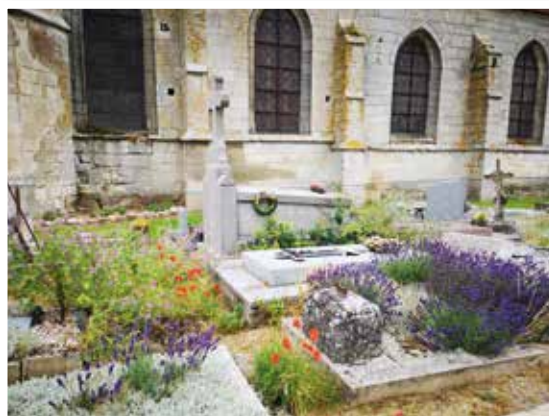
Le cimetière de Montagny-Sainte-Félicité.

Les cimetières à l'ambiance traditionnellement très minérale dans notre région adoptent ainsi une atmosphère plus douce et plus naturelle. Cette métamorphose implique évidemment une évolution de notre regard, d'où un volet de communication et de sensibilisation de la population : chantier participatif, initiation à la reconnaissance de la flore locale ou encore jardiner avec la nature.