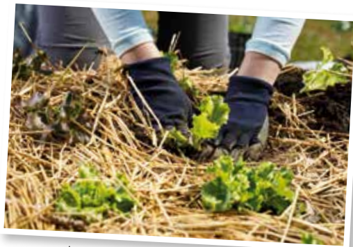
Je protège mon sol par un paillage.