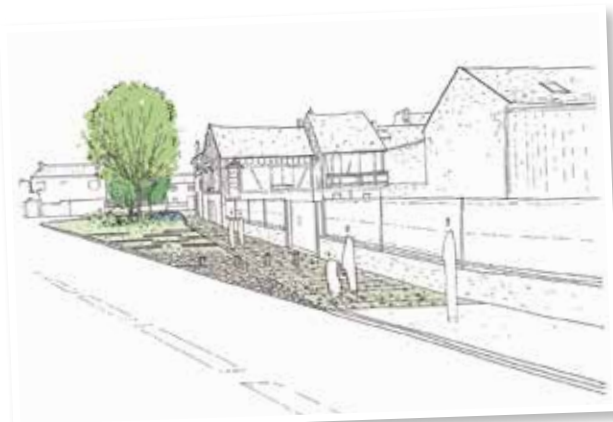
Place Emile Zola, projet pour Viarmes, bureau d'études Champ libre .

Les opérations s'appuient sur plusieurs objectifs :