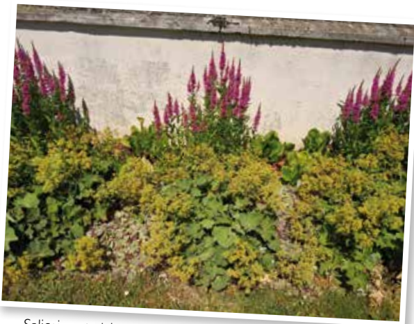
Salicaria et alchémille, hameau de Loisy à Ver-sur-Launette.