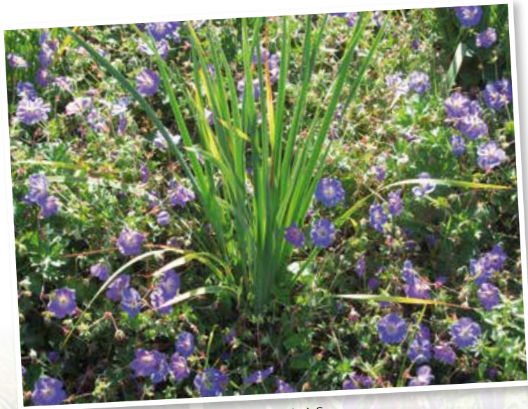
Géranium et iris à Seugy.