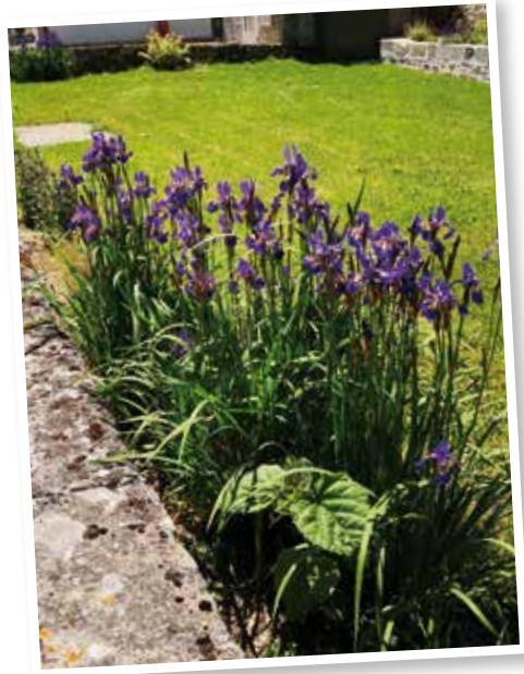
Iris à l'entrée de Barbery.

Résultat, les communes impliquées ont pu à la fois embellir leurs espaces publics et former leurs agents des espaces verts.