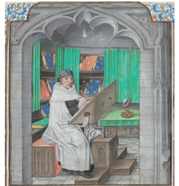
Vincent de Beauvais, Royal Ms 14E i, vol.1, f°3, British library

C'est enfin l'occasion d'évoquer le plus connu des enfants de Boran : Vincent de Beauvais (né ici vers 1184 / † en 1264). À la demande de saint Louis, ce moine dominicain supervise la rédaction de la plus importante encyclopédie médiévale: le Speculum majus , forte de 80 livres et 9 885 chapitres !