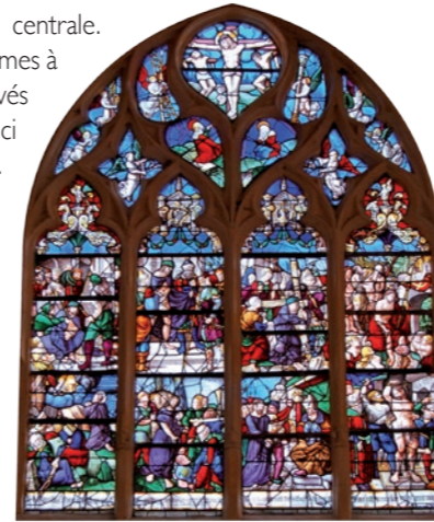
Vitraill du chœur, vers 1535

Précédée d'un porche moderne, l'édifice se compose de trois vaisseaux à chevets plats. S'il reste quelques traces du 12e siècle, l'essentiel a été rebâti à la fin du Moyen-âge (vers 1480-1550), dans le style gothique flamboyant. La petite tour, à droite de la façade, a certainement accueilli des fonts baptismaux. De nombreuses statues, des vitraux et des chapiteaux finement sculptés embellissent l'intérieur.