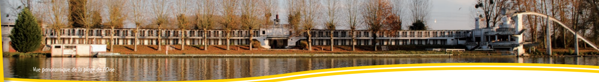
Vue panoramique de la plage de l'Oise