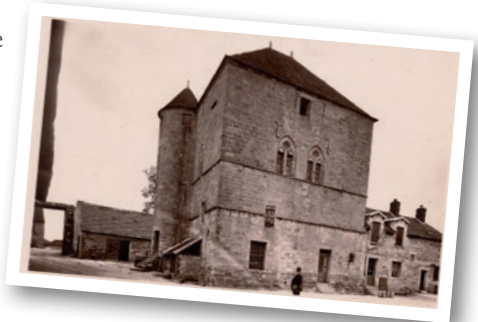
Carte postale, vers 1900

Cette maison-forte médiévale, avec tourelle d'escalier percée de meurtrières, fenêtres géminées, salle haute, est ensuite devenue le logis d'une ferme (propriété privée).