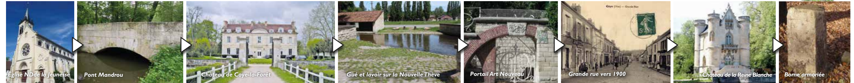
Église ND de la Jeunesse

Départ devant la mairie , face à l' église , de style néo-gothique qui date du 19 e siècle. Au 15 e s., une église paroissiale est fondée par Jean de Suze, dont les armes ornent la clé de voute du clocher. Aux 18 e s. et 19 e s., elle est plusieurs fois détruite et reconstruite. Les dernières reconstructions (1869-1875) sont réalisées par l'architecte senlisien Drin et l'on dit que les plans s'inspirent de l'ancienne église abbatiale de Royaumont. Empruntez la sente entre l'église et l'école pour arriver à l' étang et au lavoir du Chardonneret 2 alimentés par la Thève. Construit vers 1841, le lavoir a été restauré par le PNR et la commune en 2014. L'eau est très présente dans le village : au fil du parcours vous pourrez aussi admirer, rue de Luzarches, le « Petit Pont », un second lavoir et un rare exemple de gué avec ses pentes douces en dalles de grès.