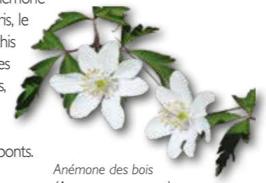
Anémone des bois (Anemone nemorosa)

Sur cette portion vous pourrez apercevoir l'Alliaire officinale, l'Anémone des bois, l'Arum tacheté, la Benoîte commune, la Circée de Paris, le Doronic à feuilles de plantain, l'Iris fétide, la Jacinthe des bois, l'Orchis pourpre, la Petite Pervenche et la Renoncule ficaire. En levant les yeux vous reconnaîtrez le Charme, le Chêne pédonculé, des érables, le Frêne, le Hêtre et le Sureau noir. Au poteau n°2, descendez à gauche pour rejoindre et traversez la route, continuez tout droit sur 400m sur la Chaussée du Porchêne en passant sur deux petits ponts.