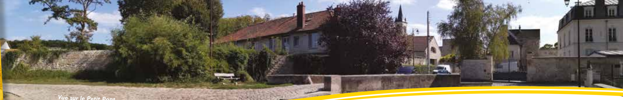
Vue sur le Petit Pont