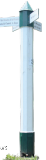
Poteau des Écouteurs

De nombreux chemins vous permettront de randonner en forêt . Vous pourrez y observer des chênes, hêtres, résineux et tilleuls. Elle a été exploitée par les bûcherons, les charbonniers, mais aussi pour la fabrication des margotins (petits fagots de bois servant à allumer les cheminées, de 1850 à 1969) ou de cordes-tilles (cordes et liens en écorce de tilleul). Les poteaux, installés aux carrefours des allées forestières pour indiquer les directions lors des chasses à courre et les bornes armoriées, délimitant les parcelles, sont les témoins du passé princier de cette forêt.