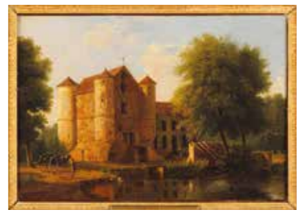
JV Bertin, Château de la Reine Blanche, v.1825

À quelque distance du village, vous voici devant le château de la Reine Blanche, les étangs de Comelles et leurs vannes. Au 13 e s. les moines de l'abbaye de Chaalis aménagent les étangs. À la fin du siècle un petit château-fort protège ces viviers à poissons, le moulin et le système hydraulique. Entre les 14 e s. et 17 e s., le site est utilisé successivement comme relais de chasse, moulin et papeterie. Au début du 19 e s. l'activité s'arrête et le moulin est détruit. Le château-fort du 13 e s. est remanié en 1825 par le prince de Condé dans le style néo-gothique (décor travaillé : pinacles, balustrades, statues de chevaliers, gargouilles...). Site prisé à la période du Romantisme, où il prend son nom actuel, il a été représenté à de très nombreuses reprises dès la fin du 18 e s. (estampes, gravures, dessins, tableaux). Le sentier longeant les étangs vous permettra de profiter du paysage.