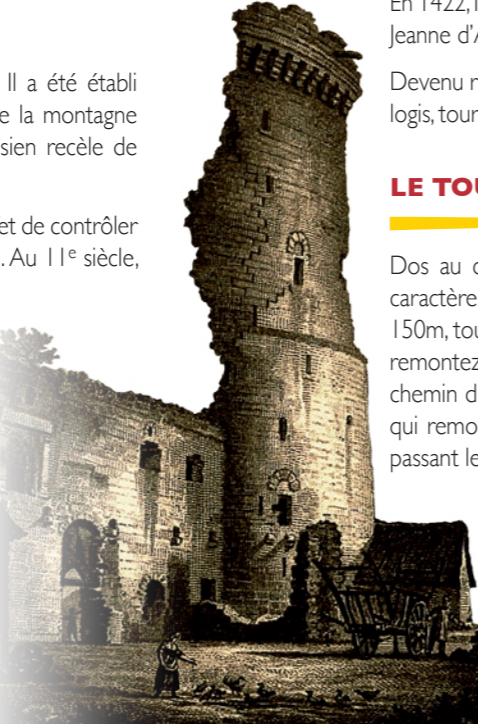
Les ruines du donjon, Civeton, 1825

L'absence d'eau au sommet conduit à la réalisation de puits profonds et de mares-abreuvoirs. Elles hébergent le « crapaud accoucheur », espèce en raréfaction, ici préservée.