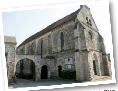
L'église et l'entrée de la ferme

Son plan est simple : un vaisseau rectangulaire de 28m par 8,5m. Il comprend 4 travées