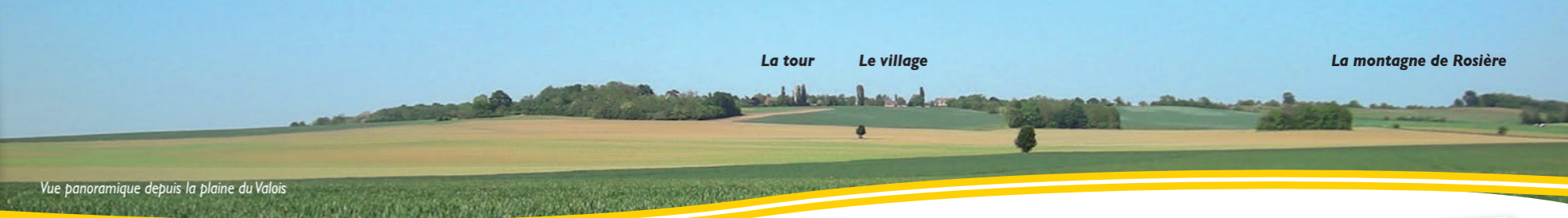
Vue panoramique depuis la plaine du Valois