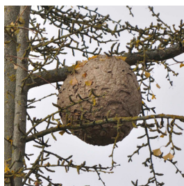
Nid d'une colonie

Oui. La destruction des colonies reste la méthode la plus efficace pour diminuer les populations de Frelon asiatique. Celle-ci doit se faire le plus tôt possible et jusqu'à mi-décembre. Le Frelon asiatique étant diurne, les nids doivent être détruits à la tombée de la nuit ou au lever du jour. Ainsi la quasi-totalité de la colonie peut être éliminée.